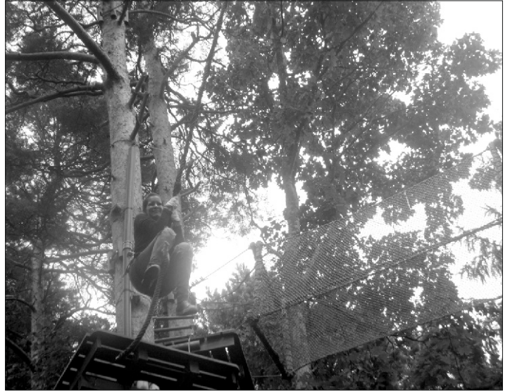
Valgeranna seikluspargis proovisid puude vahel kõrguvatel radadel julgust nii suured kui väikesed.

Bowlingut meeldib meile mängida Raplas. Seal on paraja suurusega saal, mis kahe tunni vältel ainult meie päralt. Kuuli veeretavad kõik suured ja väi-