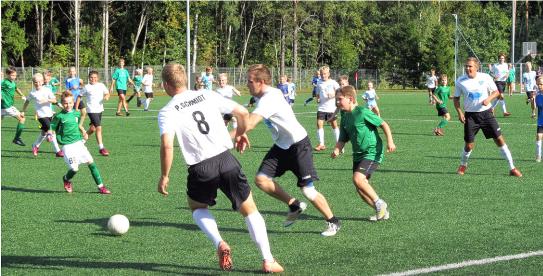
Üks vaatemängulisemaid võistlusi - klubi esindusmeeskonna mäng 100 lapse vastu.