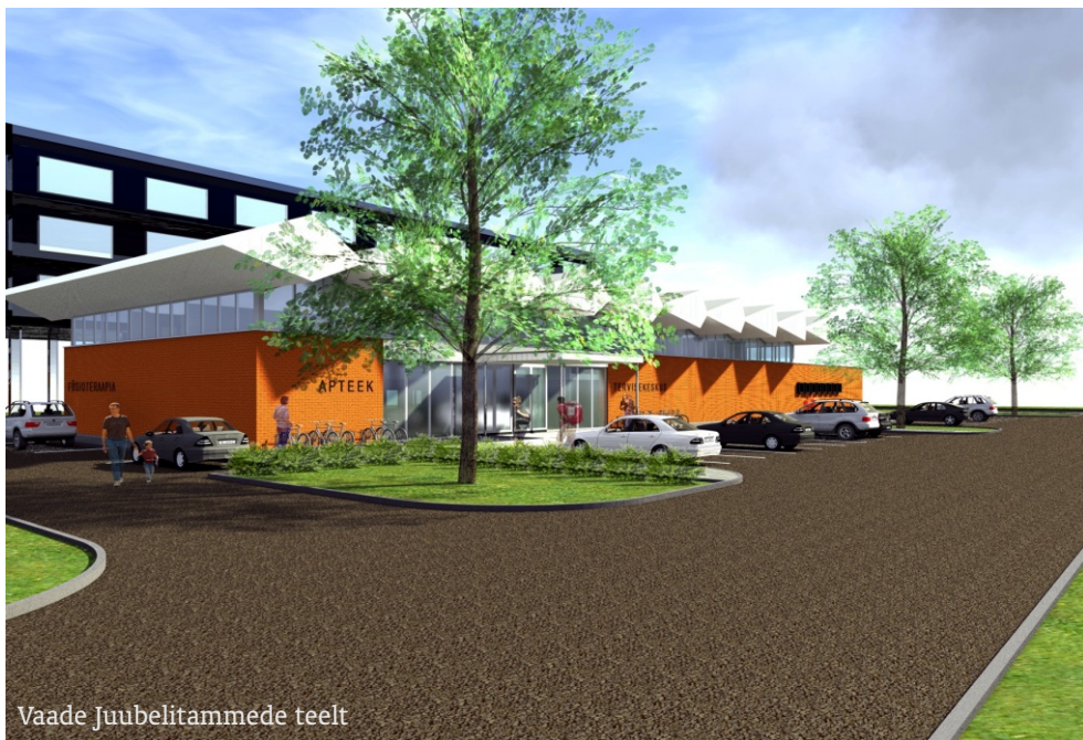
Vaade Juubelitamme teelt