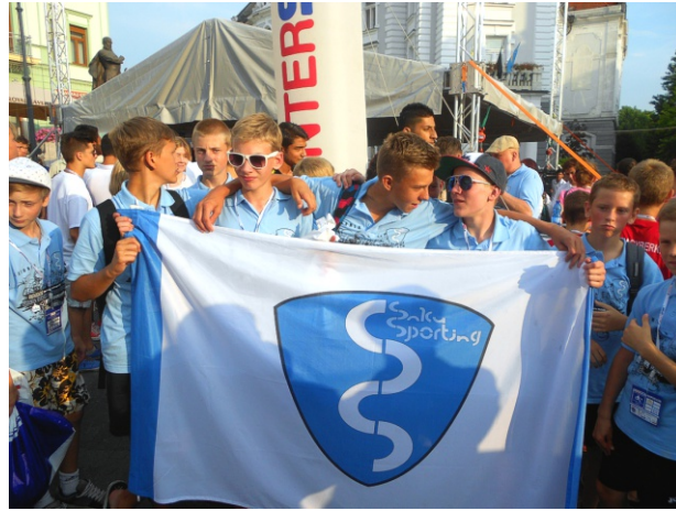
Lapsevanematest fännid ja sportlased noorte jalgpalliturniiril Ungaris.