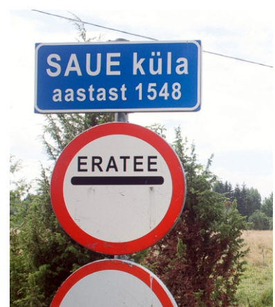
Saue külatee kuulub selle ääres elavatele peredele, igapäevase väikejupike.

Praegu elab Saue külas rahvastikuregistri andmeil 91 inimest, tegelikult aga veidi rohkem, umbes 110-120 ning pea pooled neist on põlisasukid järeltulijad, kes käisid nõukogude ajal oma esiisade taludes vaid suvitamas, kuid on nüüd juurte juurde tagasi pöördunud ning juba