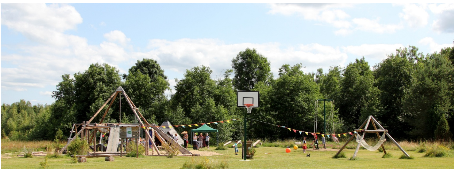
Küla keskpunktiks on PRIA, valla ning kohaliku rahva abi ja jõuga eelmisel aastal valminud karusselliga mänguväljak, üks põnevamaid oma rohkete ronimisatraksioonide ja palliplatsidega.